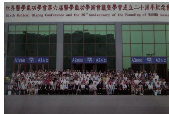
学術会議参加者による記念撮影