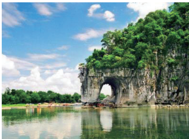
象鼻山（ぞうびざん）象が漓江に鼻を入れて水を飲んでるように見えることから名づけられた桂林の象徴です。