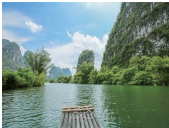
漓江下り（りこうくだり）桂林から陽朔まで、素晴らしい水墨画のようなカルスト地形の風景を堪能できます。雨季には霞がかかる神秘的な水墨画の風景が、乾季には晴れの日が多く兩岸のカルスト地形がよく見れます。